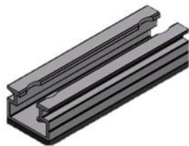
MSP-TT-CHV 100 mm